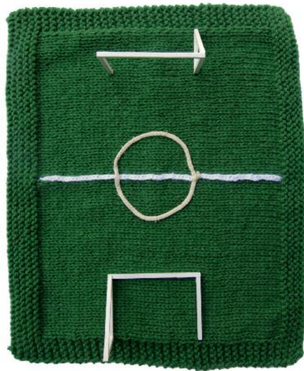
campo di lana 2017 lana, legno cm 45x39x9