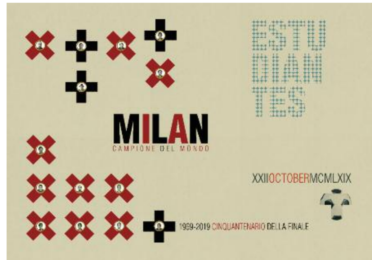
Manifesto Cinquantenario Milan campione del mondo 1969

E scopro ora che anche Kounellis giocava in porta: «All'improvviso ho un flashback – scrive Fabio Sargentini nel ricordo dell'amico scomparso quest'anno ( Il Giornale dell'Arte , marzo 2017) – di me e Kounellis che giochiamo a pallone insieme. La squadra degli artisti contro quella dei tipografi, gli stessi che avevano stampato il manifesto dei cavalli (i Dodici cavalli vivi della performance all'Attico di Roma nel 1969, ndr). Jannis disse che il suo ruolo da ragazzo era stato il portiere. E in porta infatti giocò. Peccato che finì tre a zero