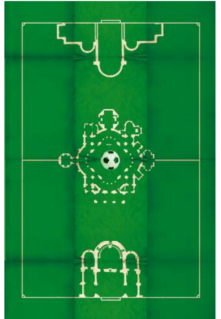
campo di chiese